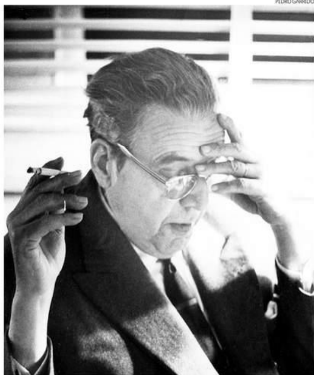
Mariano Picón Salas